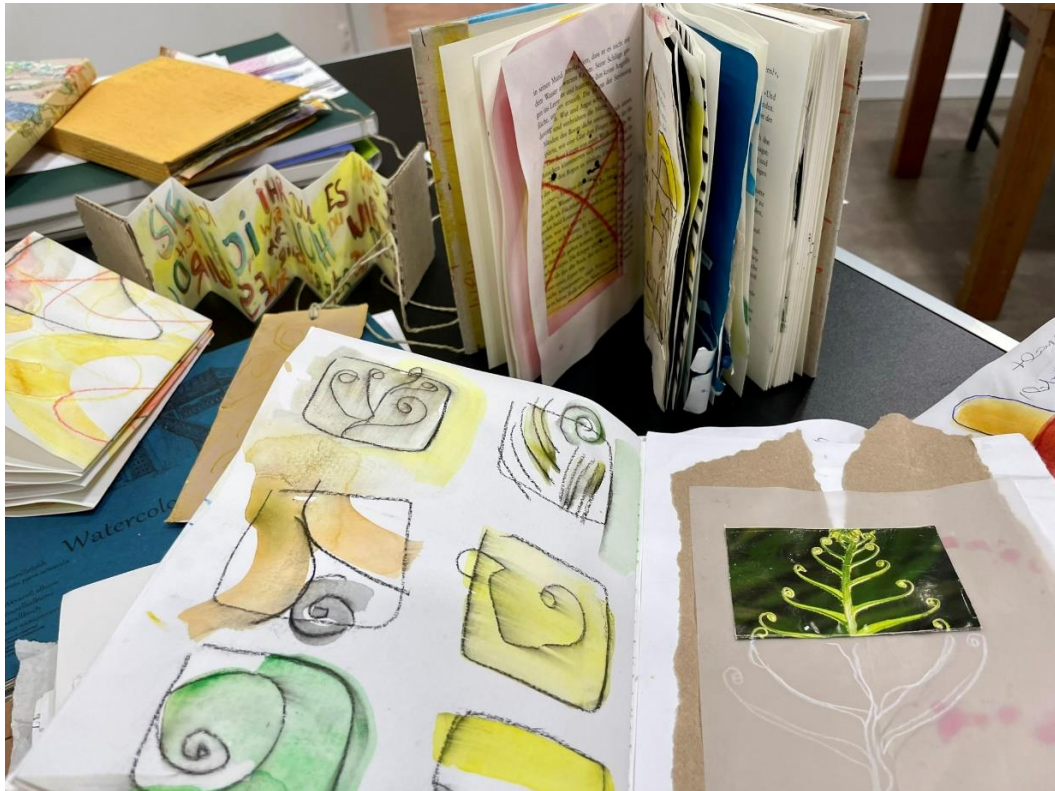
Art(work)book- Experimente; Anne Schwabe

Gesehenes, Erlebtes, Gesammeltes, Gedachtes und Erdachtes - in diesem Kurs lernst Du ganz spielerisch und experimentell, all dies in und zu Deinem ganz persönlichen „Art(work)book“ zusammen zu fügen. Dinge, die Dir am Herzen liegen oder Dich z.B. an besondere Momente erinnern finden hier ihren Platz und werden zu einem selbst gestalteten Tage-, Wochen-, Momente Buch. Dieser Kurs ist auch ideal als (Wieder-) Einstieg in Deine Kreativität, um eine künstlerische Routine zu entwickeln, dranzubleiben und auch kurze Zeitfenster im Alltag künstlerisch für Dich zu nutzen.