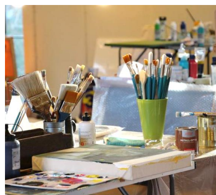
Aus dem „Werkzeugkasten“